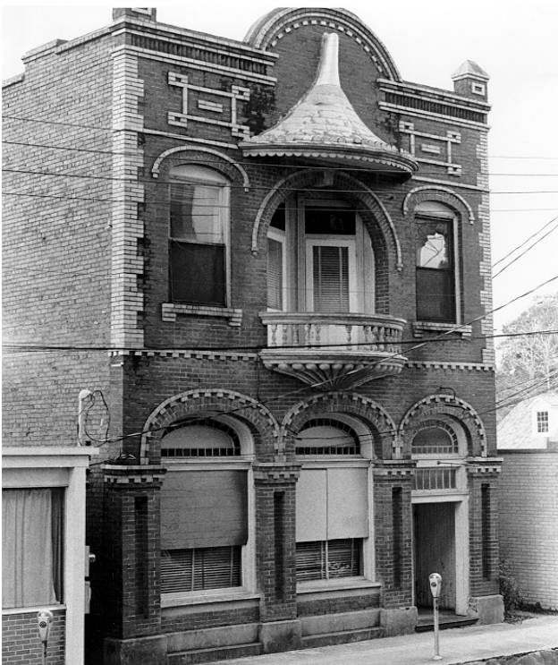
Rådhuset i Lafayette hvor tre betjente skal sørge for "sikkerheden"

Det er ikke de fattige der har problemer, men det er myndighederne her i Lafayette. Og deres problem er at de har en presse som ikke bare lader sig affærdige med pressemøder hvor sandheden ikke kommer ud. De har en presse som ikke finder sig i at blive ført bag lyset.