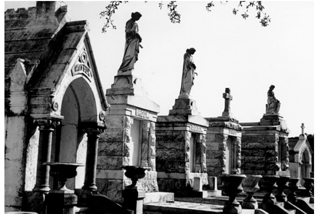
Kun englenerne kender sandheden

I stedet bruges der seks mand om dagen på at sørge for at fattige, sultne amerikanere ikke sover i gamle forladte godsvogne. I stedet